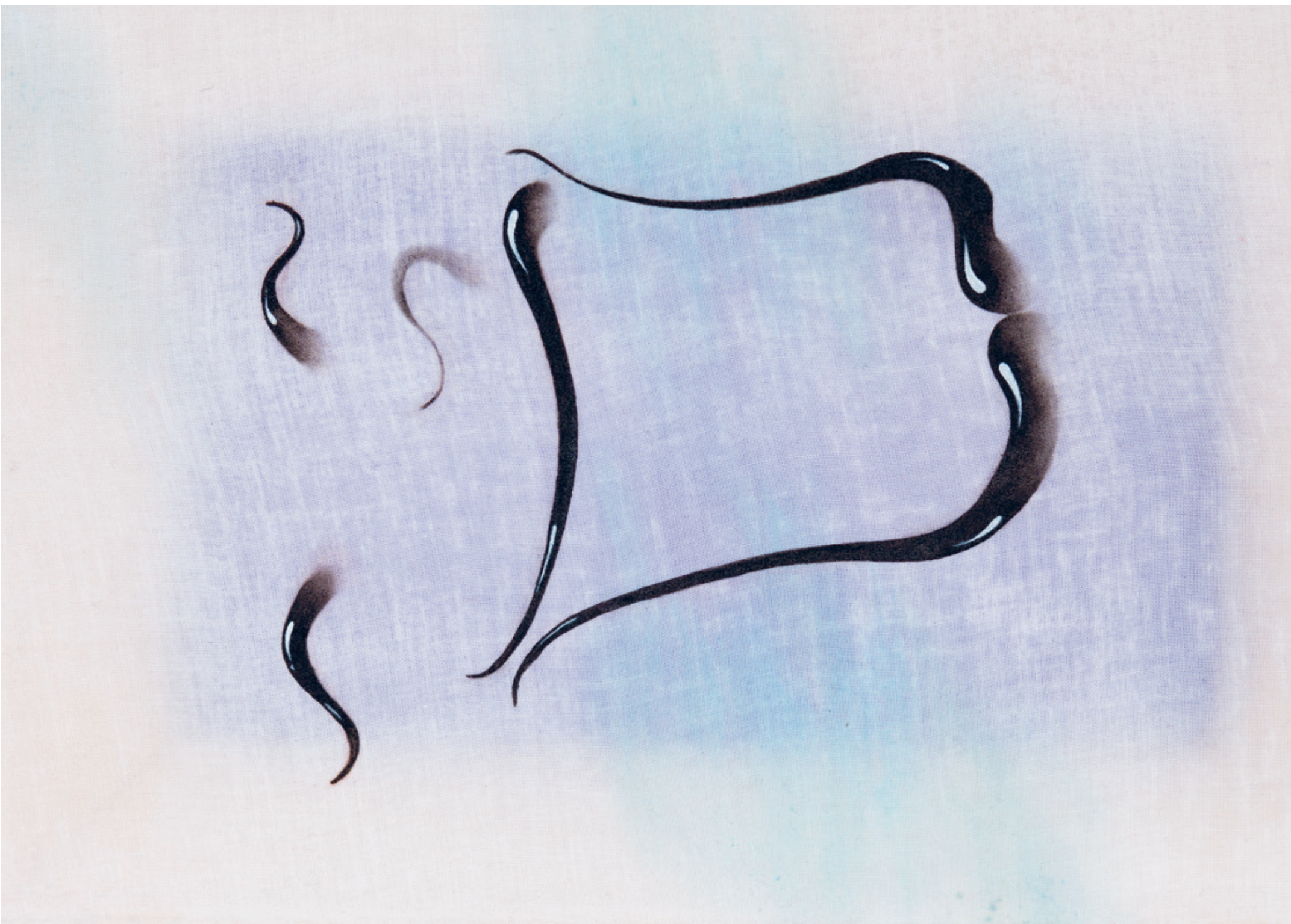
Sujet von Sophia Mairer

Tiroler Landesmuseum Ferdinandeum, Künstlerhaus Büchsenhausen, Kunstpavillon, Kunstraum Innsbruck, Vorbrenner, WEI SRAUM. Designforum Tirol und Freunde.